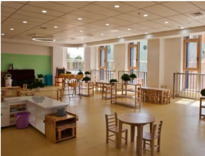
In China werden viele große Projekte im Passivhaus-Standard umgesetzt: Kindergarten X88 in Peking mit über 21 Gruppenräumen für über 600 Kinder.

Für das energieeffiziente Bauen sind auch maßgeschneiderte Lösungen möglich, wie Marcel Studer und Monte Paulsen aus Kanada verdeutlichten. Im abgelegenen Territorium der Heiltsuk realisierten sie für die First-Nation-Bewohner ein Wohngebäude für das örtliche Klinikpersonal im Passivhaus-Standard. Um den Baustandard der Wohnhäuser allgemein zu verbessern, bildeten sie die Bewohner zum Thema Energieeffizienz weiter, darunter auch im Bereich Luftdichtheit.