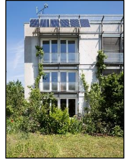
Das weltweit erste Passivhaus in Darmstadt-Kranichstein.

In einem Passivhaus hält sich die Wärme 10 bis 14 Tage lang, da sie nur sehr langsam entweicht. Daher muss nur an sehr kalten Tagen aktiv geheizt werden. Insgesamt ist nur wenig Energie für die Bereitstellung dieser Restwärme vonnöten. Im Sommer (sowie in warmen Klimaten) ist ein Passivhaus ebenfalls im Vorteil: Dann bewirkt u.a. die gute Dämmung, dass die Hitze draußen bleibt. Eine aktive Kühlung ist daher in Wohngebäuden in der Regel nicht nötig. Durch die niedrigen Energiekosten sind die Nebenkosten kalkulierbar - eine Grundlage für bezahlbares Wohnen und sozialen Wohnungsbau. Ein Passivhaus verbraucht rund 90 Prozent weniger Heizwärme als ein bestehendes Gebäude und 75 Prozent weniger als ein durchschnittlicher Neubau.