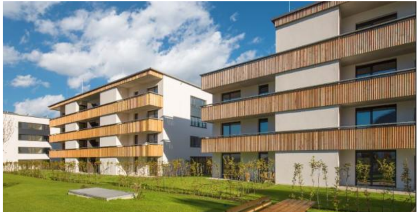
Energieeffizient und kostengünstig: Sozialer Wohnungsbau der Baugesellschaft Neue Heimat Tirol in Kufstein.